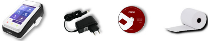
Drukarka POSPAY z terminalem D220